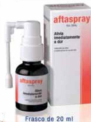
Frasco de 20 ml